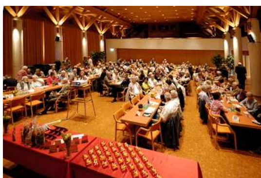
Swissmovie Regio 3 2012 Uetikon