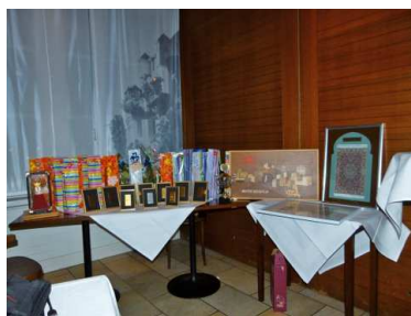
unser prächtiger Gabentisch