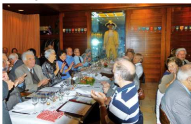
wer wird wohl eine Medaille gewinnen?

ist ein wichtiges Datum, nämlich das Datum des Regionalen Festivals 2012 der Region 3. Macht mit, es lohnt sich! Auch das Publikum kann einen tollen Preis gewinnen. Mehr Informationen findet ihr auf dem beiliegenden Informationsblatt.